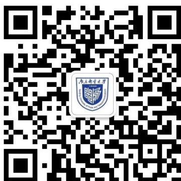
南邮继教院微信公众号